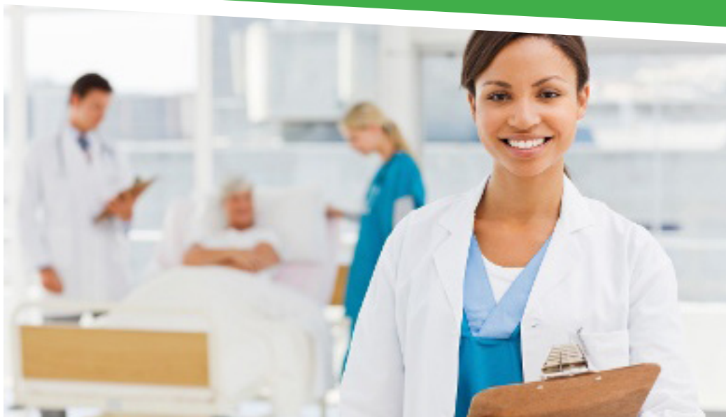
2. "Tiftix ta' kura tas-saħħa fi Stat Membru ieħor tal-UE: id-drittijiet tiegħek", ipubblikata mill-Kummissjoni Ewropea