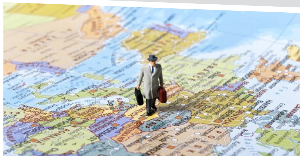
1 "EU Commission report on the operation of Directive 2011/24/EU on the application of patients' rights in cross-border healthcare (4th September 2015)".

Fl-Ewropa 10% biss taċ-ċittadini Ewropej jafu dwar l-eżistenza tal-Punti ta' Kuntatt Nazzjonali, f'Malta 24% tal-Maltin biss jafu dwar il-Punt ta' Kuntatt Nazzjonali. 1